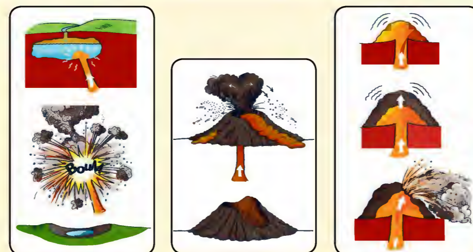
1 ● Dôme volcanique 2 ● Cône volcanique 3 ● Maar

Les maars : en remontant à la surface, la lave rencontre une masse d'eau, provoquant une violente explosion. Le cratère d'explosion ainsi formé se remplit d'eau pour devenir un lac ou un marécage (ex : le lac Pavin).