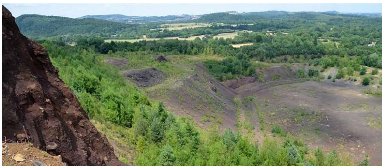
Vue sur la carrière du Puy de Paugnat au premier plan