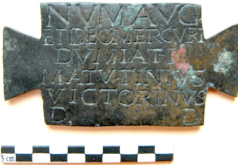
Plaque en bronze gravée - L : 6,5 cm Découverte dans la salle dite « de la dédicace » (cf. fiche 7) en 1874 Conservée au musée Bargoin, Clermont-Ferrand Fac-similé présenté à l'Espace Temple de Mercure