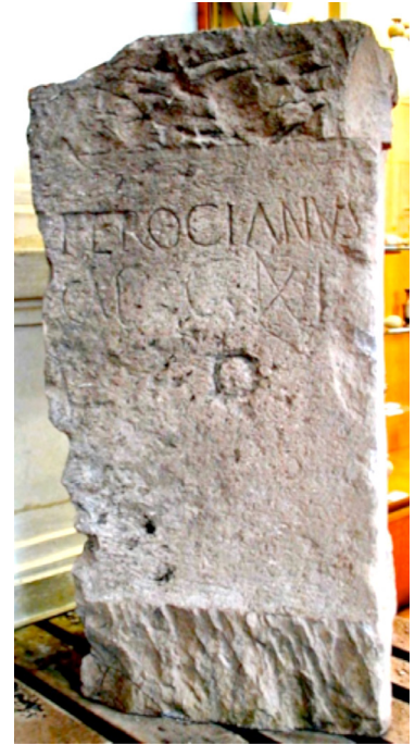
Bloc avec dédicace - hauteur : environ 1,20 m découvert en 2003 Conservé au musée Bargoin Clermont-Ferrand - © Musée Bargoin Fac-similé présenté à l'Espace Temple de Mercure