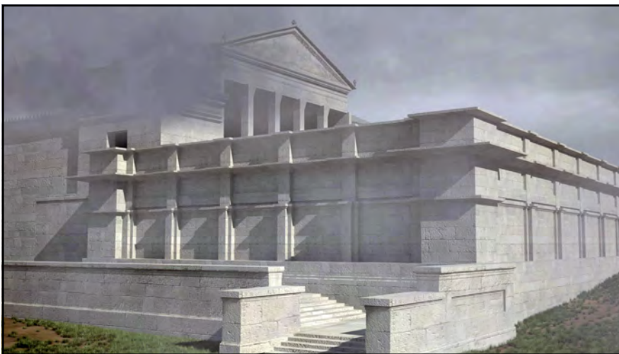
Reconstitution du sanctuaire